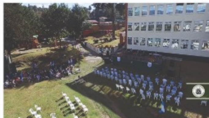
CAMPUS: LA ALBORADA

¡ Nuestras nuevas instalaciones están listas para recibir a nuestros estudiantes !