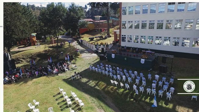
CAMPUS: LA ALBORADA

¡Nuestras nuevas instalaciones están listas para recibir a nuestros estudiantes!